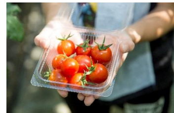
収穫したミニトマト（愛知）