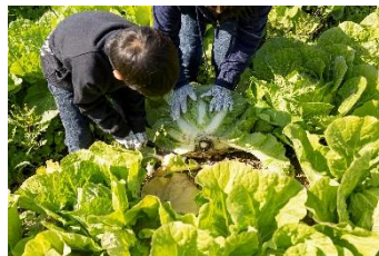
はくさい収穫体験（北海道）