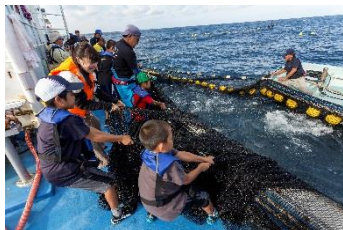
定置網漁業体験（沖縄）